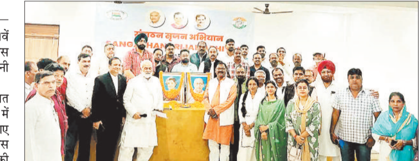
राष्ट्रीय एकता पुनः स्थापित करने का संकल्प लिया गया