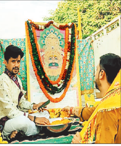
हरिभूमि न्यूज ▶▶ कोतवा

धर्मनगरी कोतवा के तिलगोड़ा प्रांगण स्थित श्री श्याम मंदिर के 26वें वर्ष पूर्ण होने के उपलक्ष्य में एकादशी पर्व बड़े धूमधाम से मनाया गया। शनिवार को कार्तिक एकादशी महोत्सव का धूमधाम से आयोजन किया गया। इस अवसर पर निशान यात्रा, भजन संध्या, 56 भोग, श्रीश्याम रसोई सहित अन्य आयोजन श्याम भक्तों ने किया।